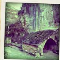
le four à pain

Au-delà des toitures, perchés, se dressent les vestiges du château .