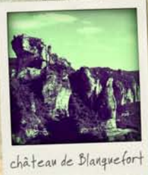
château de Blanquefort

Entre les X e et XIII e siècles, un grand nombre de châteaux, dont le rôle était à la fois politique, militaire et économique, furent édifiés. Érigés sur des massifs rocheux, en des lieux dominants et jugés sensibles. Ils symbolisaient la puissance seigneuriale. Dans la seconde moitié du XVI e siècle, de nouveaux châteaux apparurent mais sans fonction militaire. On les appelle le plus souvent des châteaux résidences.