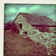
jasse à Cauquenas

Aujourd'hui, certains sont transformés en usines hydroélectriques.