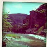
moulin de la Malène

En direction de Sainte-Enimie, rive droite, se trouve un ancien moulin.